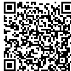
Vollzeit: Oberarzt (w/m/d)